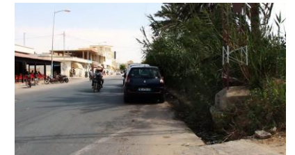
Vidéo 2: Création d'activités de Tourisme solidaire dans les oasis. Exemple en Tunisie.

Le tourisme responsable pourrait être une action économique bénéfique aux écosystèmes oasiens. La présente vidéo montre une expérience unique de développement par le biais du tourisme solidaire dans l'Oasis de Chenini, au sud de la Tunisie. Des exemples similaires sont conduits dans les oasis Nord Africain et permettent un appui économique aux oasiens.