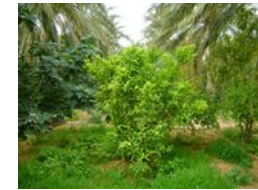
Figure 1 et 2: Richesse de la biodiversité végétale oasienne

participative des ressources naturelles dans les agrosystèmes oasiens. Des exemples de ces projets existent dans tous les pays oasiens (notamment en Nord Afrique) conduits par des associations de la société civile.